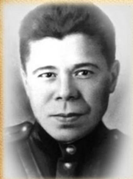
Фатих Карим 1908-1945